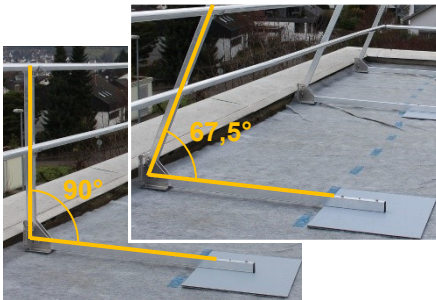
Aufstellwinkel 90° oder 67,5°

Durch Auflast gehaltenes Arbeitsschutzgeländer nach EN 13374 Klasse A für temporäre Arbeiten auf extensiv begrünten Flachdächern mit Attika.