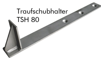
Traufschubhalter TSH 80

Stabiles Winkelprofil aus Edelstahl mit Entwässerungsschlitzen und Lochung im Auflageschenkel zur Fixierung auf der Dachabdichtung.