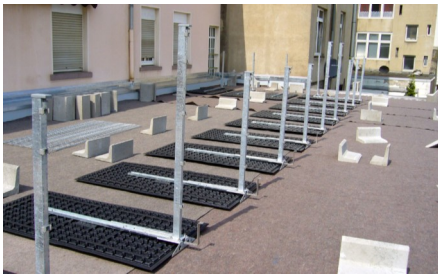
Einmessen und Auslegen der Geländerbasis GB, sowie ...