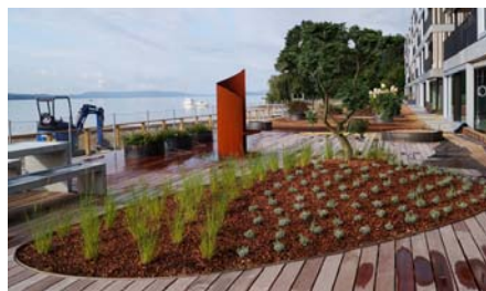
Auch unter den mit Stahlbändern abgegrenzten Pflanzinseln wurde Floradrain® FD 60 eingebaut.