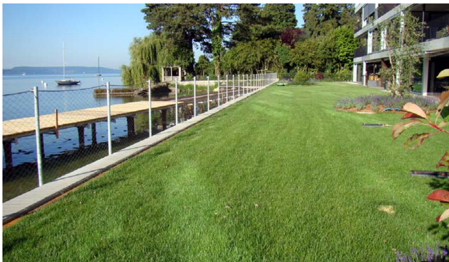
Die überwiegend als Rasenfläche angelegte Tiefgaragenbegrünung erstreckt sich über drei Wohngebäude.