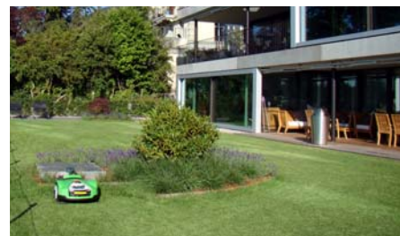
Der Rasen auf der Tiefgarage wird durch einen Mähroboter gepflegt.