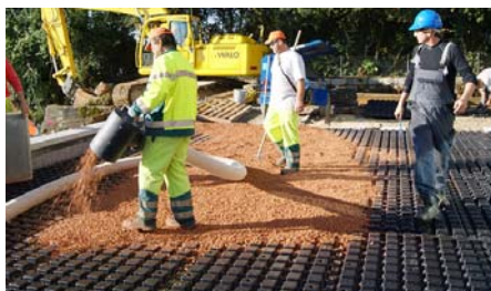
Die Drain- und Wasserspeicherelemente Floradrain® FD 60 wurden mit Zincolit® Plus verfüllt.