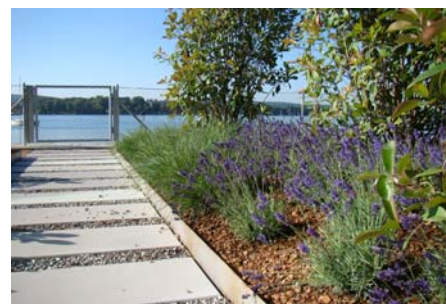
Die Wohnungen der drei neuen Wohngebäude haben einen direkten Zugang zum Bielersee.