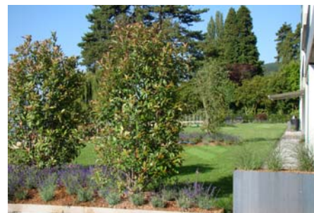
Stauden, Sträucher und Kleinbäume wurden nach einem definierten Konzept auf der Dachfläche gepflanzt.